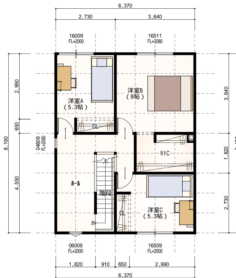
2階 平面図 S:1/100